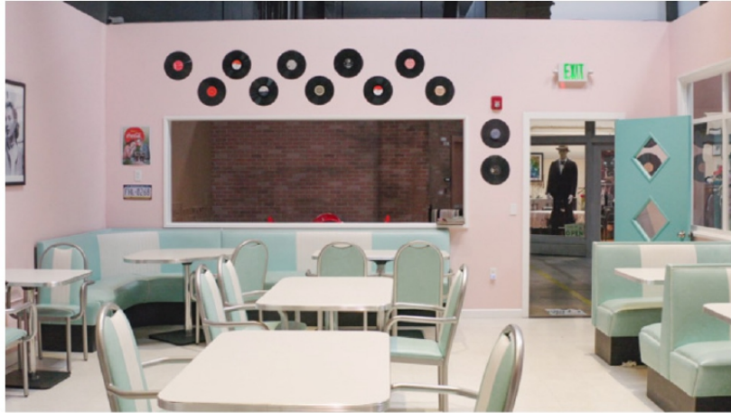
Julien Discrit - Forever Reverb 3 , 2023 - Galerie Anne-Sarah Bénichou