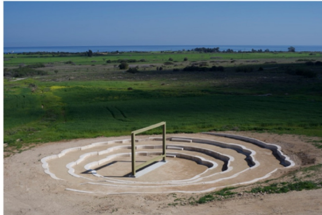
Rosa-Barba - Open air cinema installation

Projet extrêmement dynamique, OFFSCREEN invite l'artiste et cinéaste contemporaine émérite, Rosa Barba, avec son oeuvre Inside the Outset .