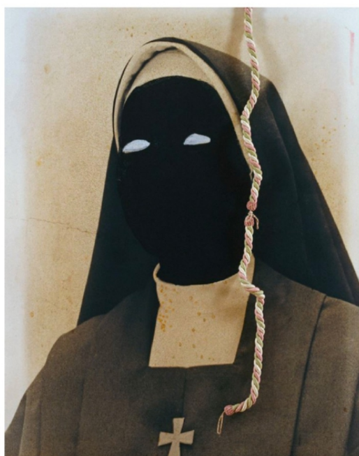
Carmen Calvo - No es lo que parece, 1999 - Galerie Luis Adelantado