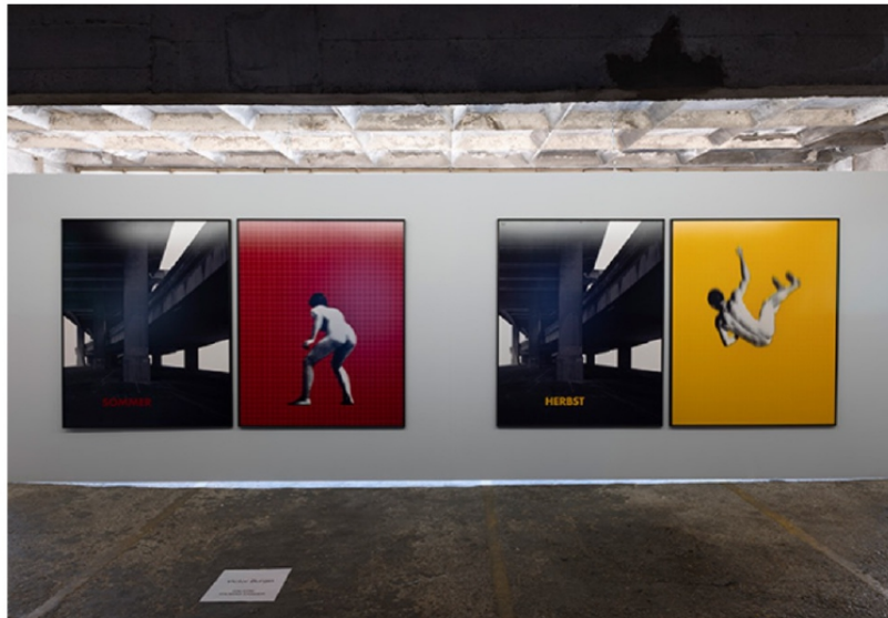
In situ - Victor Burgin Herbst - Four-Seasons , 1993 - Galerie-Thomas-Zander