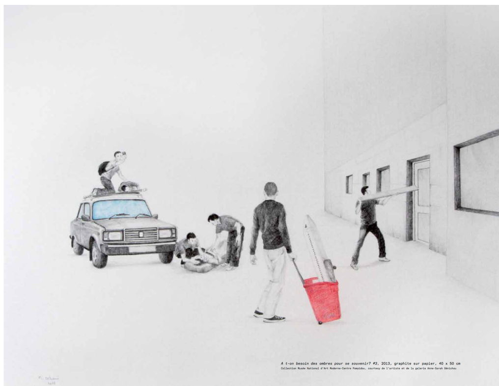
A t-on besoin des ombres pour se souvenir? #3, 2013, graphite sur papier, 40 x 50 cm Collection Musée National d'Art Moderne Centre Pompidou

Œuvre exposée dans le cadre de la biennale de Venise, 2015