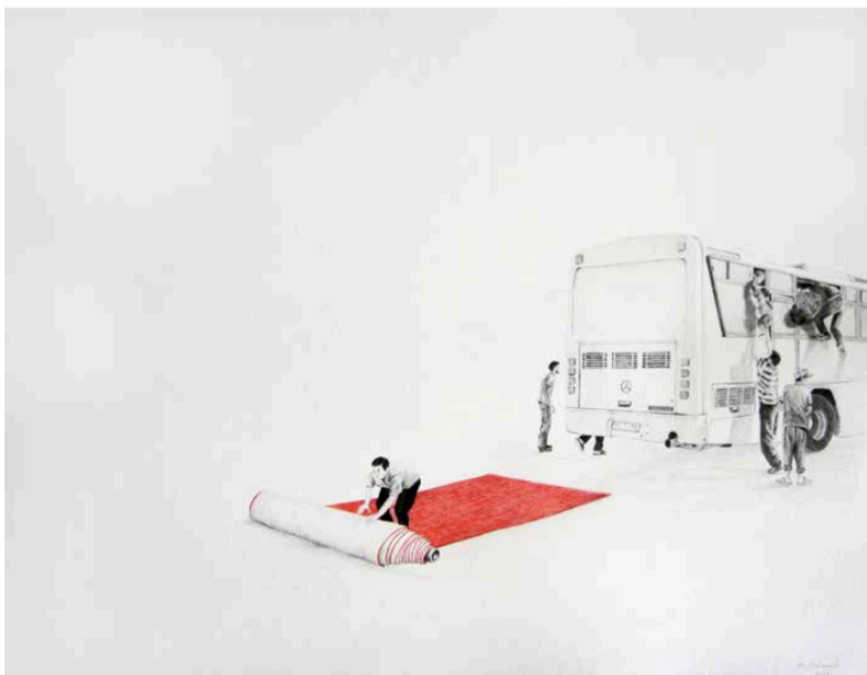
A t-on besoin des ombres pour se souvenir? #1 , 2013, graphite sur papier, 40 x 50 cm Collection Musée National d'Art Moderne-Centre Pompidou