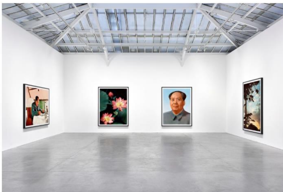
Exhibition view: Thomas Ruff, tableaux chinois, David Zwirner, Paris (14 January–6 March 2021).