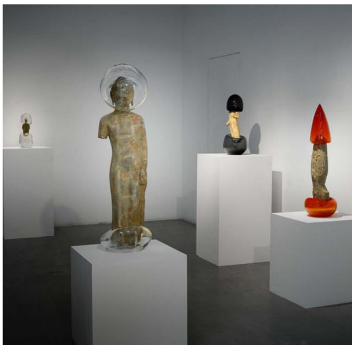
Vue de l'exposition Etrangement Beau de Zhuo Qi, Paris Beijing