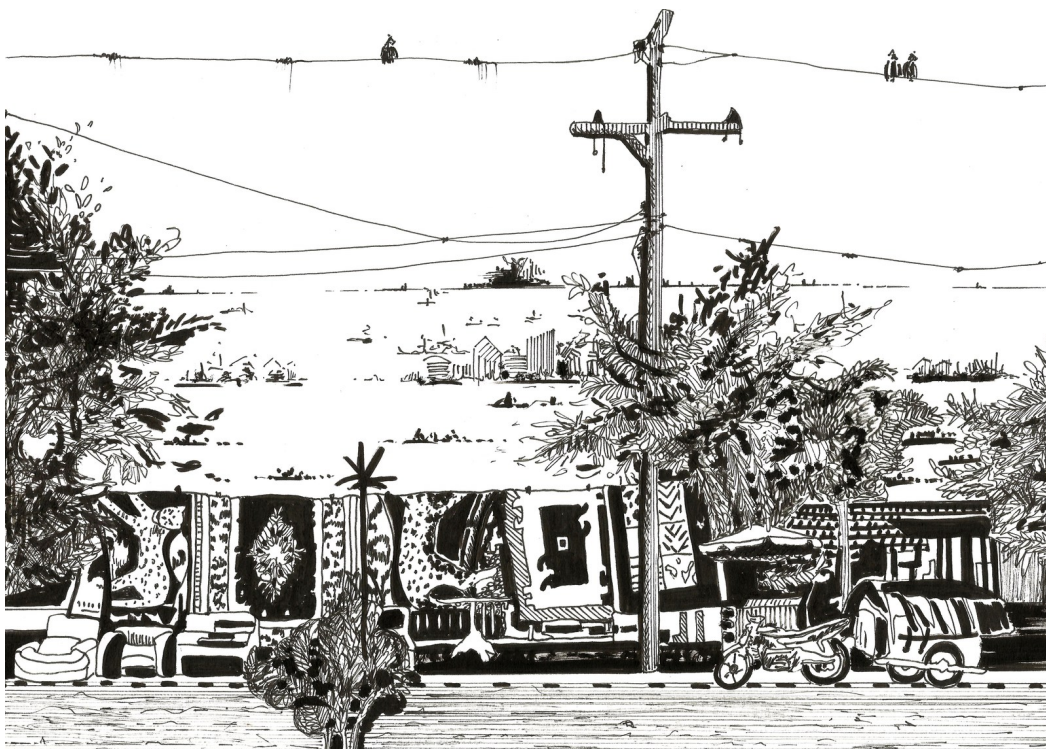
1 ère Rencontre avec Doula #13, 2016, encre de Chine sur papier, 18 x 24,5 cm