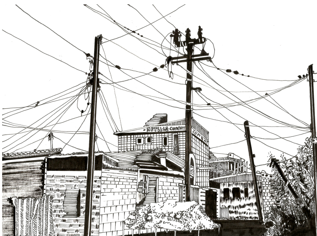
1 ère Rencontre avec Doula #20, 2016, encre de Chine sur papier, 18 x 24,5 cm