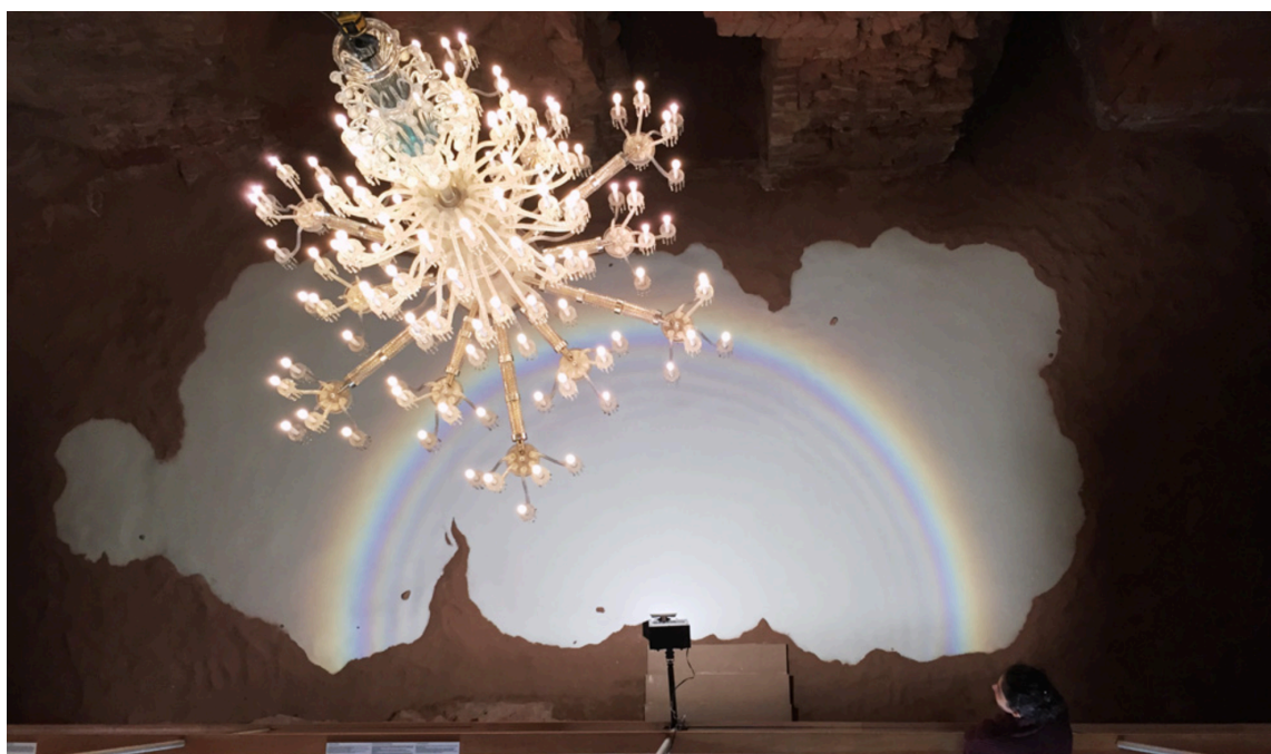
Arc-en-Ciel , 2016-2018, microbilles de verre, sable blanc, LED, dimensions variables. Vue de l'installation à La Grande Place, musée du Cristal Saint-Louis, Fondation d'entreprise Hermès