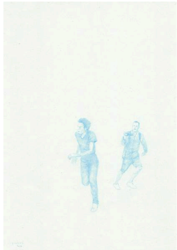
Résolutions #2 et #5, 2017, mine couleur sur papier recyclé, 21 x 29,7 cm chaque