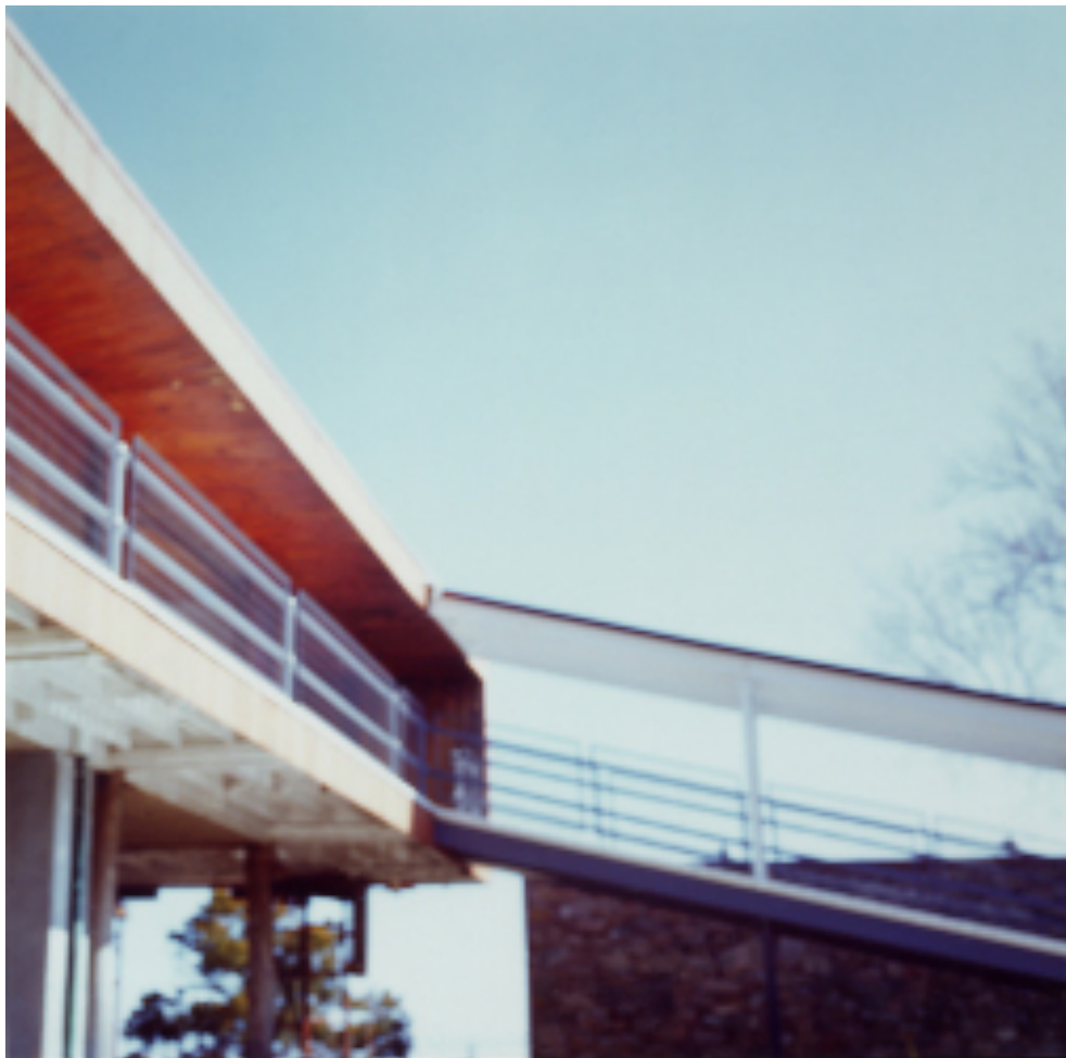
Sliding Rocks in House , 2003, série « Guest House », C-Print, 122 x 122 cm

L'artiste photographe américaine Seton Smith vit entre Paris et New York depuis plusieurs décennies. Avec constance, des expositions dans de grandes institutions américaines et européennes rendent hommage à son travail. La galerie Anne-Sarah Bénichou souhaite signer son retour dans la ville qui l'a fait connaître et qui nourrit son travail, par le biais d'une exposition personnelle d'œuvres emblématiques et muséales.