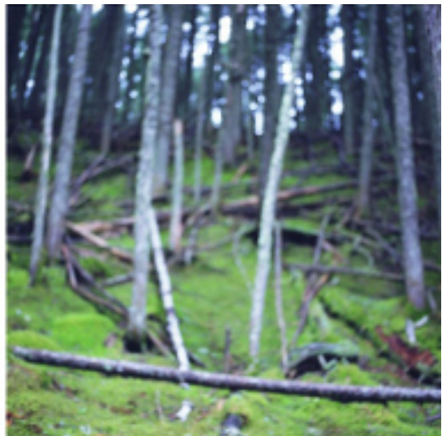
Falling Trees #3, 2006, Avalanche Creek, C-Print et Plexiglas, 180 x 180 cm chaque