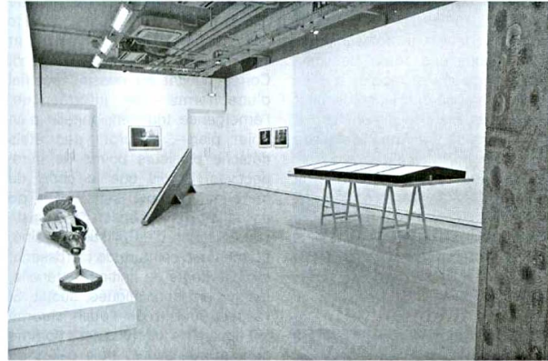
«La consistance du visible». Vue de l'exposition.