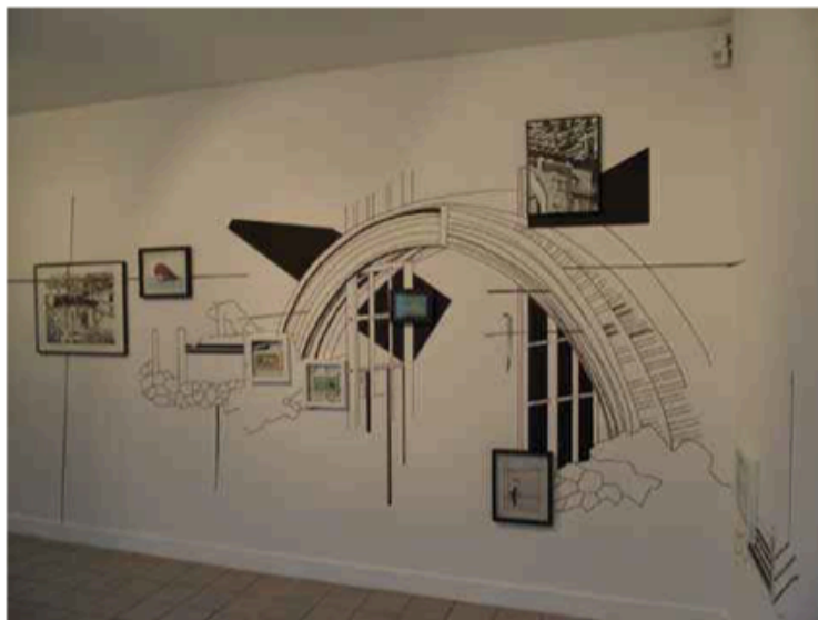
Chourouk Hriech, Trajectographie #1, (2016). Dessin in situ

Hommage au paysage, une longue tradition de l'histoire de l'art, Paysages sublimés explore ce genre artistique. Comment des artistes contemporains nous livrent-ils une proposition subjective, poétique, inattendue ou étonnante, dans l'invitation au voyage, à la rêverie, à l'imaginaire ou à l'irréel ?