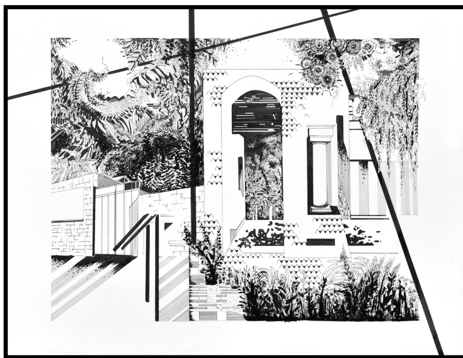
Chourouk Hriech, Des pierres et des racines #3 , 2015, 55cm/65cm, encre de chine sur papier Canson, Collection privée.