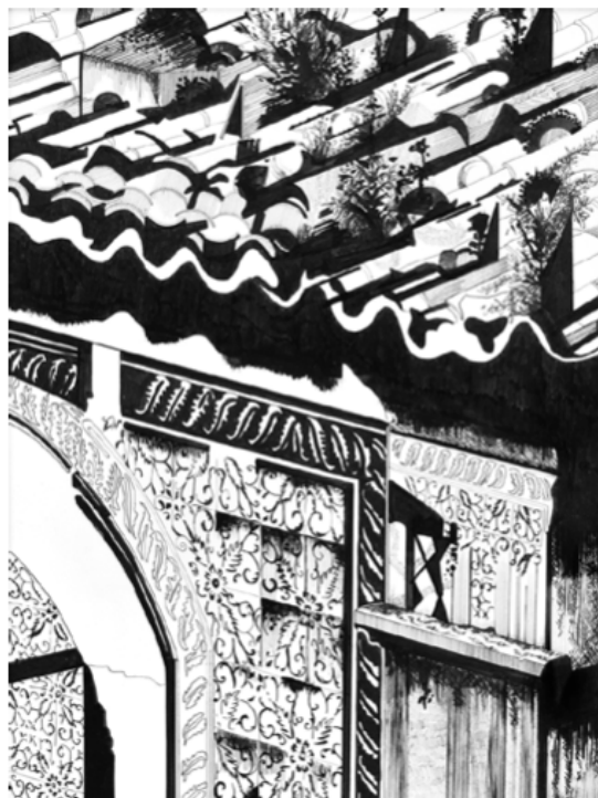
Chourouk Hriech, Dehors , dessin A3, encre de chine sur papier.

SUITE DE LA PAGE 10 bestiaire, caricatures, plans, illustrations, il se lit sans mots... il a vraiment cette particularité de tendre vers l'édifice en devenir ou fantasmé, il permet d'échafauder. Il apporte à la fois l'énigme et la solution à chaque regard qui cheminerait au fil de ce qu'il est : tracés, couleurs, noir et blanc, perspectives, naturalisme, abstraction... N'est-ce pas d'ailleurs par ces caractéristiques, en prise avec le réel et tout ce qui ne se voit pas, qu'il suscite un véritable intérêt chez des collectionneurs ?