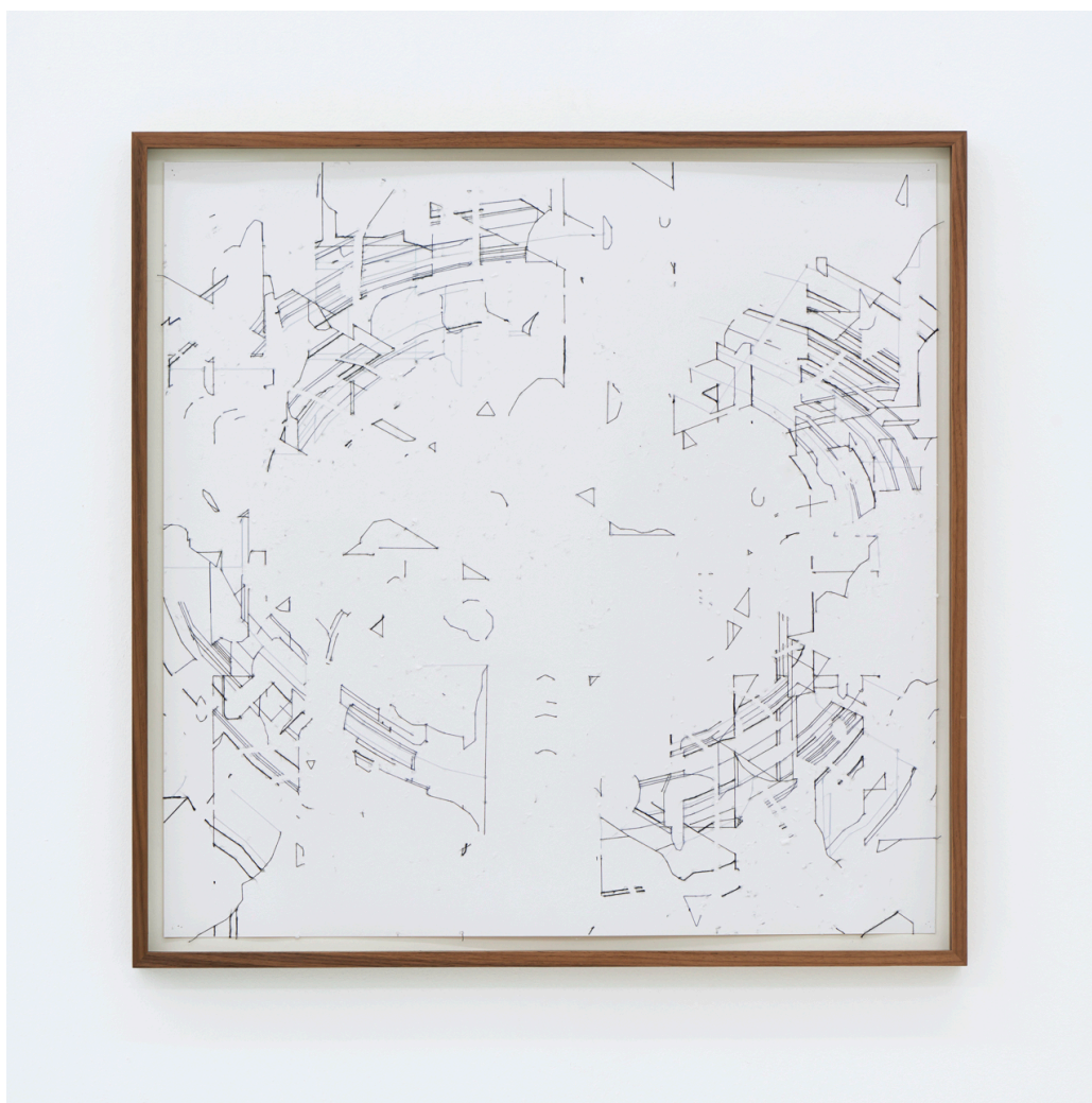
Keita Mori, Bug report (Circuit) , 2014, fils de coton sur papier, 50 x 50 cm