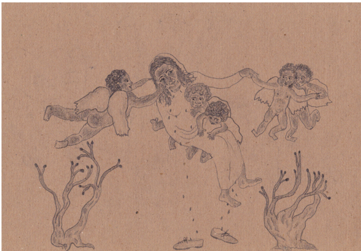
Anna López Luoa, Visions antiques , 2015, série de 12, crayon sur papier, 20x 29 cm