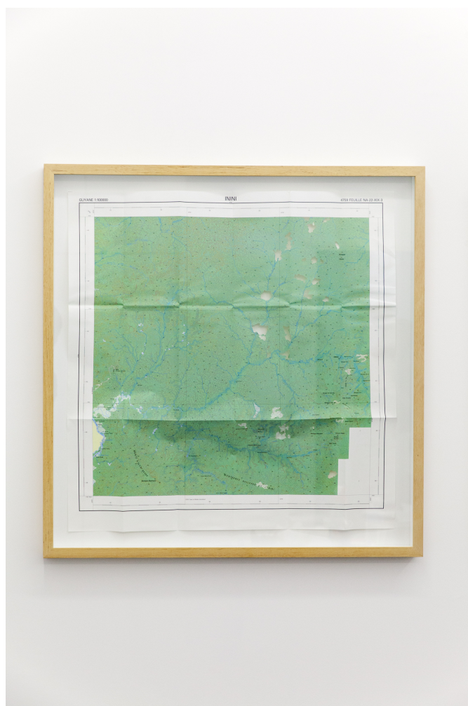
Julien Discrit, Terrae incognitae-Inini , 2015, carte ajourée, 80x 80 cm