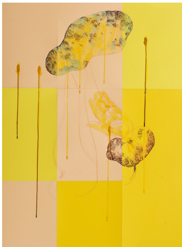
Mario D'Souza, série Suspension , 2016, encre, aquarelle, crayon sur papier, 100 x 60 cm