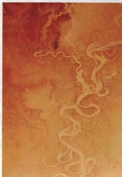
Mille Mississippi #2, 2016

«Julien Discrit - Le souvenir des pierres» jusqu'au 16 juillet · 45, rue Chapon · 75003 Paris 01 44 93 91 48 · http://annesarahbenichou.com