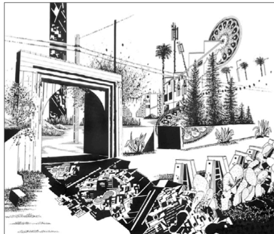
Chourouk Hriech, L'Arche , gouache sur toile.

IL EST AUJOURD'HUI ENTENDU QUE LE DESSIN EST À LA BASE DE BEAUCOUP DE CHOSSES PAR SA DIMENSION PROSPECTIVE DANS BIEN DES PROJETS