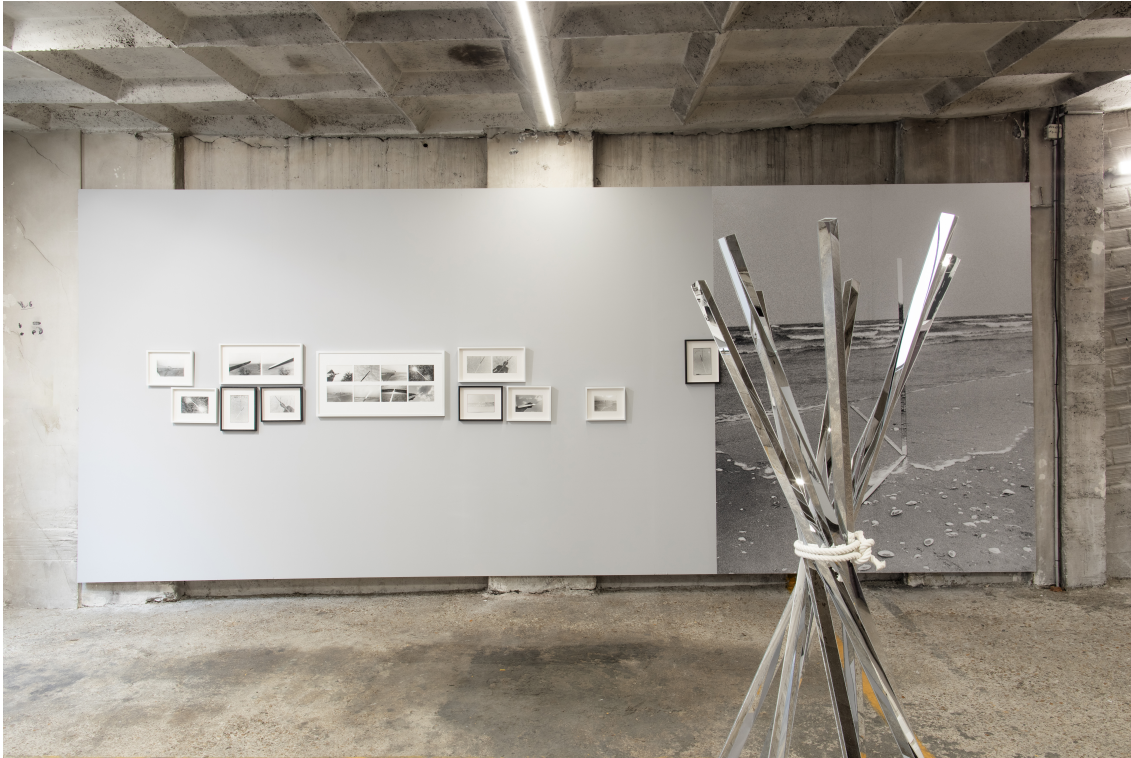
OFFSCREEN 2024 Stand E.09 - étage 2A Decebal Scriba