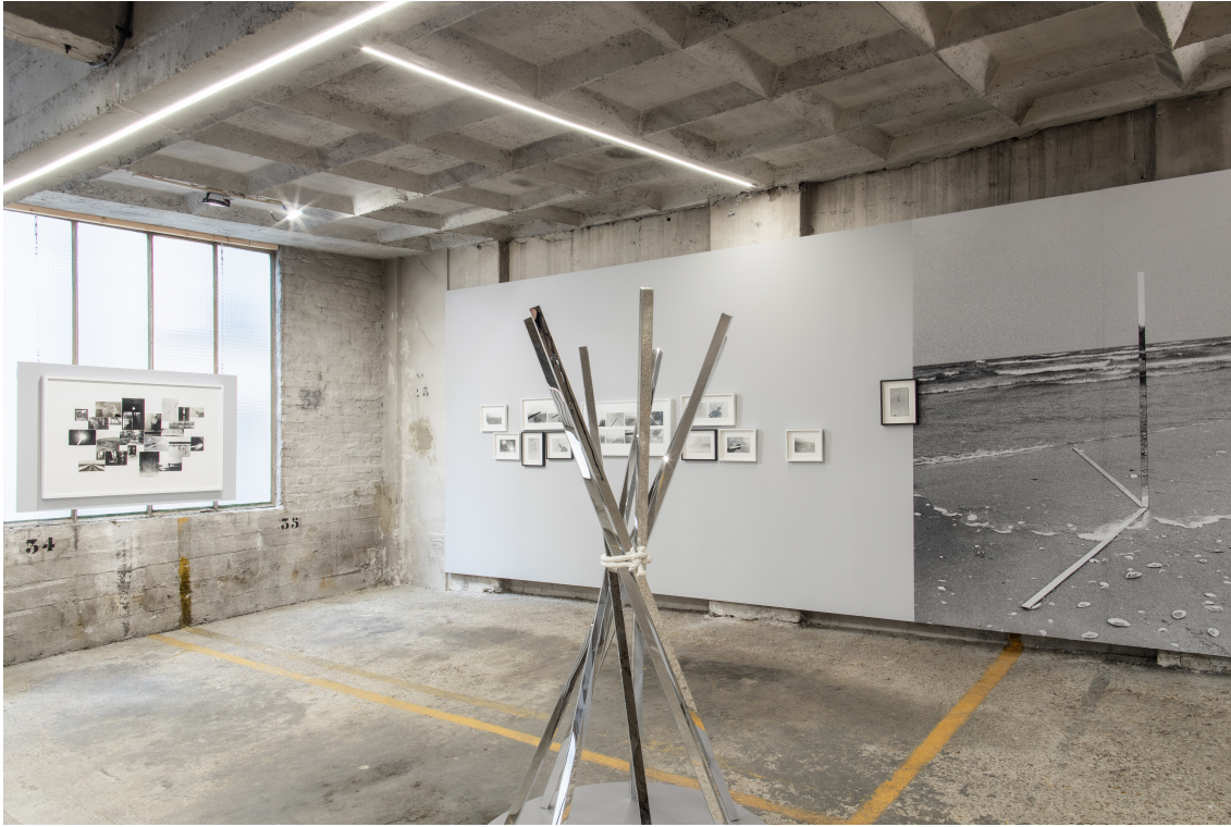
OFFSCREEN 2024 Stand E.09 - étage 2A Decebal Scriba