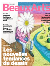
Maxime Verdier, l'Échappée belle , 2021. En couverture de Beaux Arts Magazine, mai 2022.