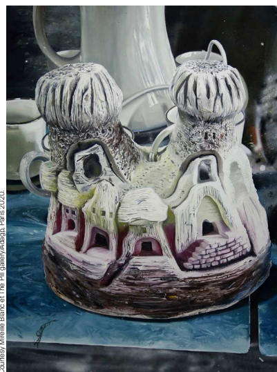
Mireille Blanc, Édifice,

2020, huile et spray sur toile, 95 x 110 cm.