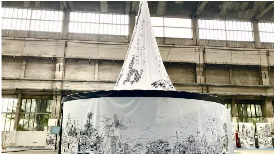
L'artiste franco-marocaine déploie ses dessins poétiques sous une gigantesque tente khäïma, abritant un écosystème sans frontières et hors du temps.

Un tunnel long comme la carlingue d'un avion, des photos de clés de Gaza, un mur recouvert de pages d'un livre, la 17e Biennale de Lyon multiforme, réunit sur neuf sites 78 artistes français et étrangers, confirmés et émergents.